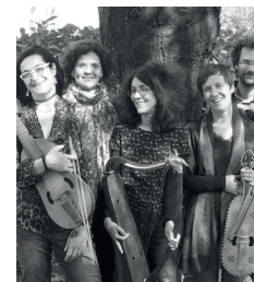
Alla Francesca Ensemble de musique médiévale