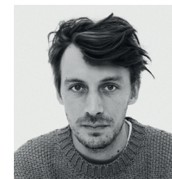
Yuksek Compositeur de musique